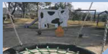
Parc del Patufet a l'Alzineta PÀG. 8