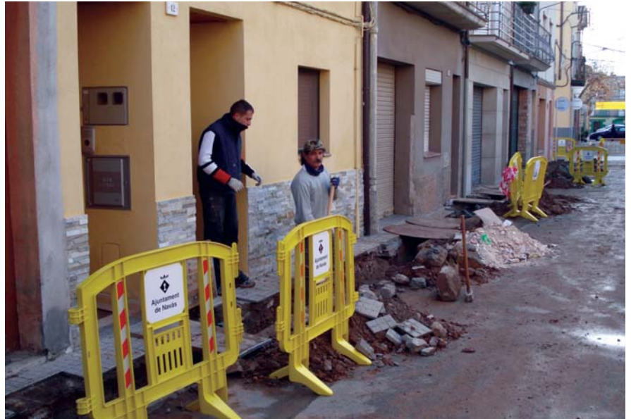
Les obres de renovació i manteniment s'han multiplicat. A la imatge el carrer de la Pau

L'Ajuntament de Navàs ha fet una important obra de millora en un tram del carrer de la Pau, entre Joan Pascual i Sant Josep, amb la renovació de tota la vorera i les conduccions d'aigua de la xarxa potable i el clavegueram. S'ha canviat el paviment d'un tram del carrer Pau Casals i s'han renovat els embornals de la majoria de carrers del casc antic de Navàs. També hi ha hagut millores a la maquinària que fa funcionar la font lluminosa de la plaça de l'Ajuntament, s'han fet 20 nínxols nous al cementiri, s'han canviat les portes d'accés al Pavelló Municipal Esportiu i s'han fet més millores al vestíbul del Casal Sant Genís. Aquest grup de treballadors també ha estat l'autor de les actuacions en matèria de senyalització horitzontal a la pràctica totalitat dels carrers de la població. S'han pintat les cantonades de les voreres amb les indicacions de color groc que delimiten l'espai que han de respectar els vehicles estacionats. La brigada també ha repintat les senyals de stop i cedeu el pas a la calçada, els passos de vianants i s'han substituït les rajoles espatllades a les voreres.