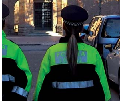
Imatge dels agents de la Policia Local