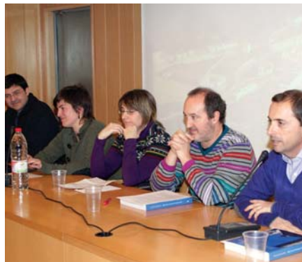
Imatges de les presentacions a Palà i a Navàs