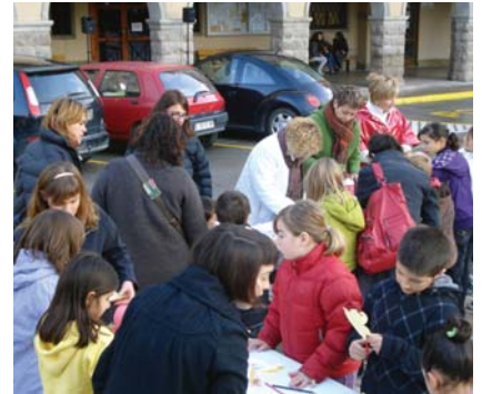
Els infants van ser protagonistes