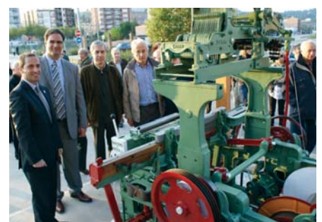
Imatge del teler inaugurat amb motiu de la fira

destacar la completa oferta d'activitats paral·leles organitzades per animar i dinamitzar el certamen. Actes com la tradicional Trobada de Puntaires amb 225 participants de diferents poblacions, la roda d'esbarts, l'exposició de 24 artistes locals amb 60 obres, l'audició de sardanes i l'exposició de material cinematogràfic antic o bé la projecció de pel·lícules i les demostracions en 3D van tenir molt èxit.