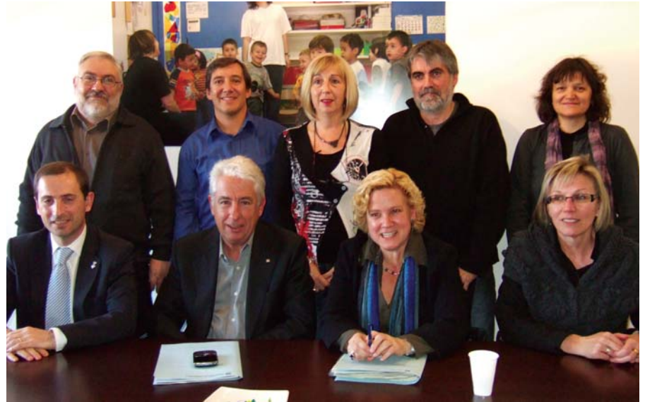
Els signants del conveni es van reunir a Manresa

Així doncs Navàs estrenarà el nou model de centre que estableix la nova llei d'educació i que s'anomena institut-escola, on s'englobarà també el col·legi Sant Jordi. Es tracta d'un únic projecte educatiu dels 3 als 16 anys que es posarà en funcionament en una desena de pobles de Catalunya. Abans de la construcció d'un nou centre destinat a l'ESO, el departament d'Educació instal·larà mòduls compactes prefabricats en els terrenys que facilitarà l'Ajuntament de Navàs.