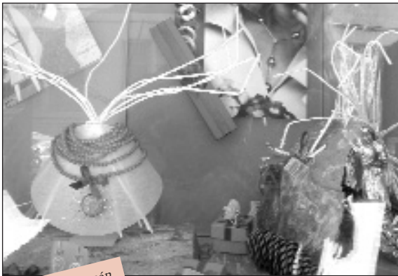
Els aparadors són la millor eina de promoció de les botigues