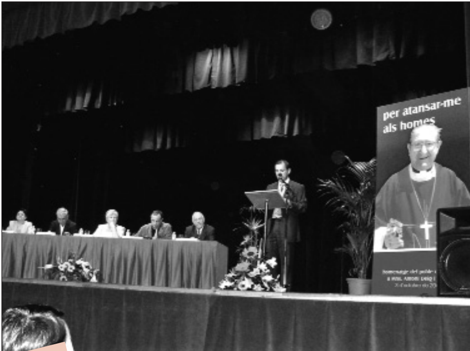
Un moment de l'homenatge a Deig

El bisbe Antoni Deig va rebre el 3 d'octubre passat el reconeixement i homenatge de tot Navàs, el seu poble, on va néixer i on va passar la darrera etapa de la seva vida. L'Ajuntament, amb aquesta