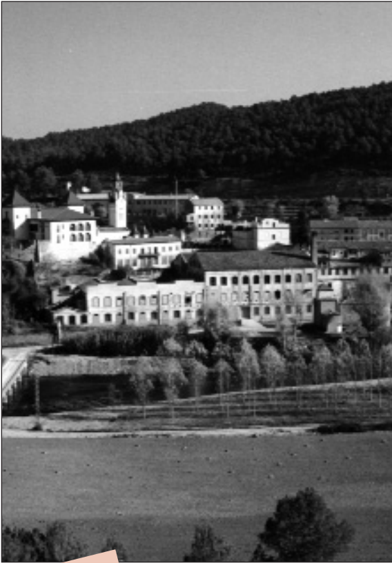
Imatge de Palà