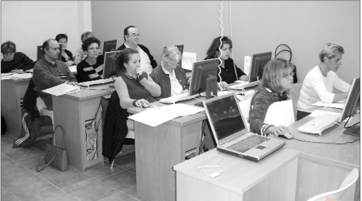
Imatge d'un dels cursos de formació que es porten a terme

L'Ajuntament ha programat diferents accions de caràcter formatiu per tal de facilitar que les persones que van quedar-se sense feina puguin recol·locar-se a curt o mitjà termini. Els cursos que es porten o portaran a terme estan pensats perquè també hi puguin accedir altres veïns de Navàs que tenen ganes d'estar ben formats per afrontar les exigències de l'actual vida laboral.