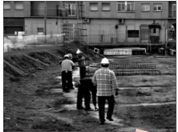
Les obres de construcció de la llar d'infants ja són en marxa

Pel que fa a l'escola pública Sant Jordi, el departament d'Educació de la Generalitat ha presentat, aquesta tardor, el projecte d'ampliació d'aquest centre escolar que actualment es troba saturat.