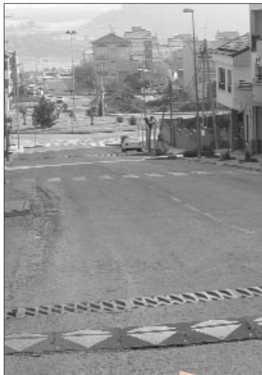
Al Passeig Circumval·lació s'han posat bandes rugoses

També s'està treballant en la revisió i actualització de tota la senyalització urbana de Navàs.