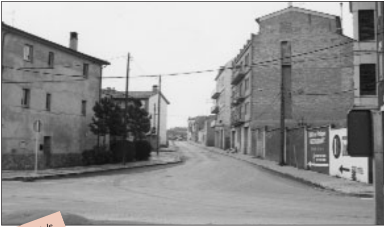
Imatge dels barris que Navàs vol agregar

El passat dia 11 de novembre vam presentar a la Generalitat l'expedient d'agregació dels nuclis de Cal Rata i Cal Nosa per tal que es doni per aprovat definitivament, ja que l'Ajuntament va donar per acabada la tramitació municipal.