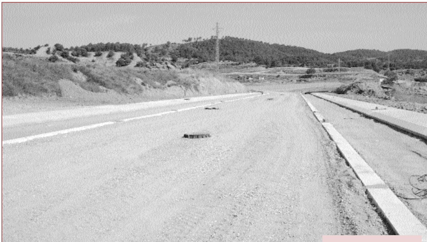
Dues imatges preses fa pocs dies. Les obres d'urbanització de la nova zona industrial ja estan molt avançades