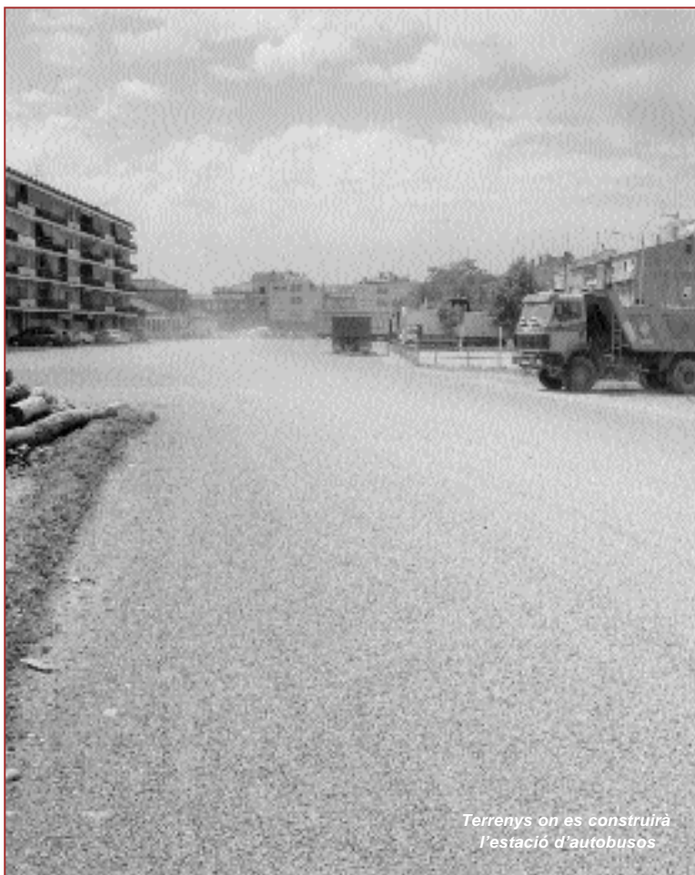
Terrenys on es construirà l'estació d'autobusos

El pressupost de la Generalitat per fer realitat aquest nou equipament, que podrà acollir fins a quatre autobusos al mateix temps, és de prop de 50.000 euros. L'Ajuntament navassenc ha manifestat la seva satisfacció per la decisió de la Generalitat de construir a curt termini aquesta estació d'autobusos tan necessària.