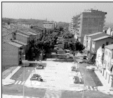
Passeig Ramon Vall