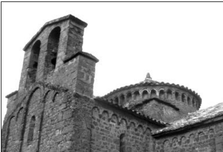
Una imatge de l'església de Sant Cugat del Racó

La Plaça és una revista d'informació municipal, editada per l'Ajuntament de Navàs.