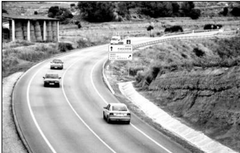
Les obres a l'eix del Llobregat convertiran la carretera en una via veritablement europea

A principis del 2001 començaran les obres de l'esperada ampliació de l'eix del Llobregat. El desdoblament es farà, en aquesta fase, entre Sallent i el límit municipal de Puig-reig