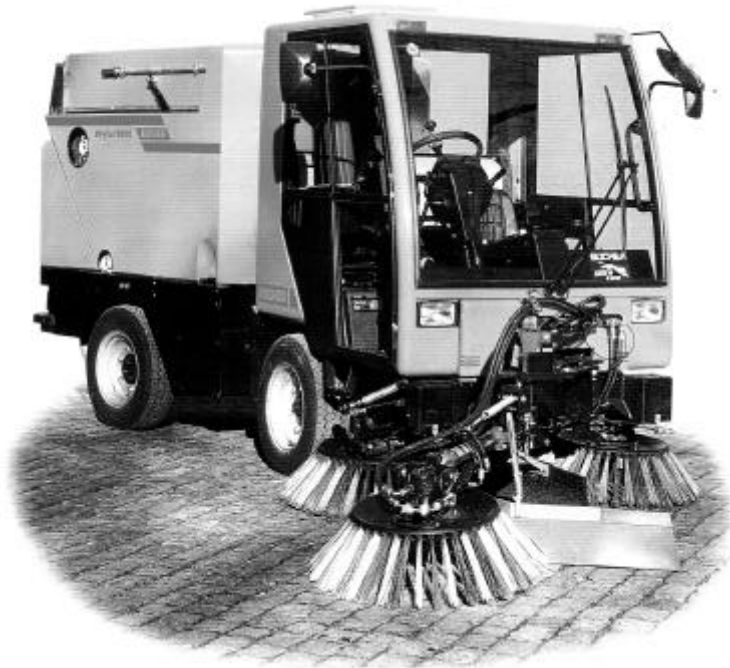
Un dibuix del nou camió que s'utilitzarà per a la neteja del poble

A partir del nou any, els veïns de Navàs notaran canvis en la neteja viària, un servei que fins ara portava a terme directament una brigada municipal que disposava d'un vehicle tipus dumper adaptat. Ara, la responsabilitat de la neteja als carrers del poble