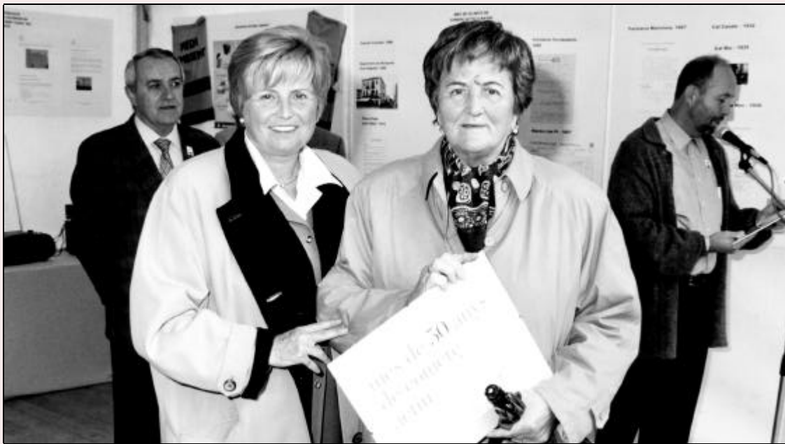
Un dels comerços guardonats va ser la farmàcia Maristany