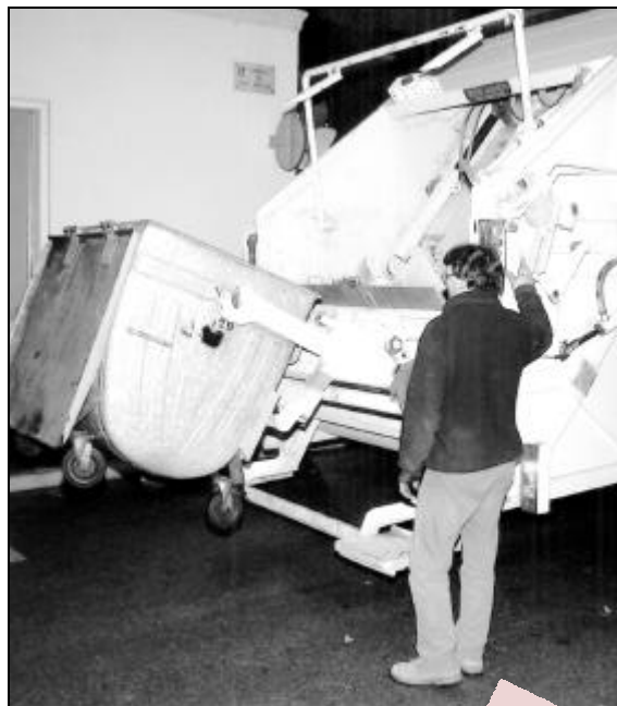
El preu de la recollida de brossa queda en 8.100 pessetes anuals

Els impostos relacionats amb la creació de nous llocs de treball i activitat econòmica no s'apugen. Un dels que afecta més persones és el relacionat amb els vehicles que, per exemple, s'apuja 170 pessetes respecte l'any anterior per a vehicles de 8 a 12 CV fiscals. Hi ha algunes taxes que tot i que pugen lleugerament encara no permeten autofinçar el servei. Aquest és el cas del cementiri, reg, residus