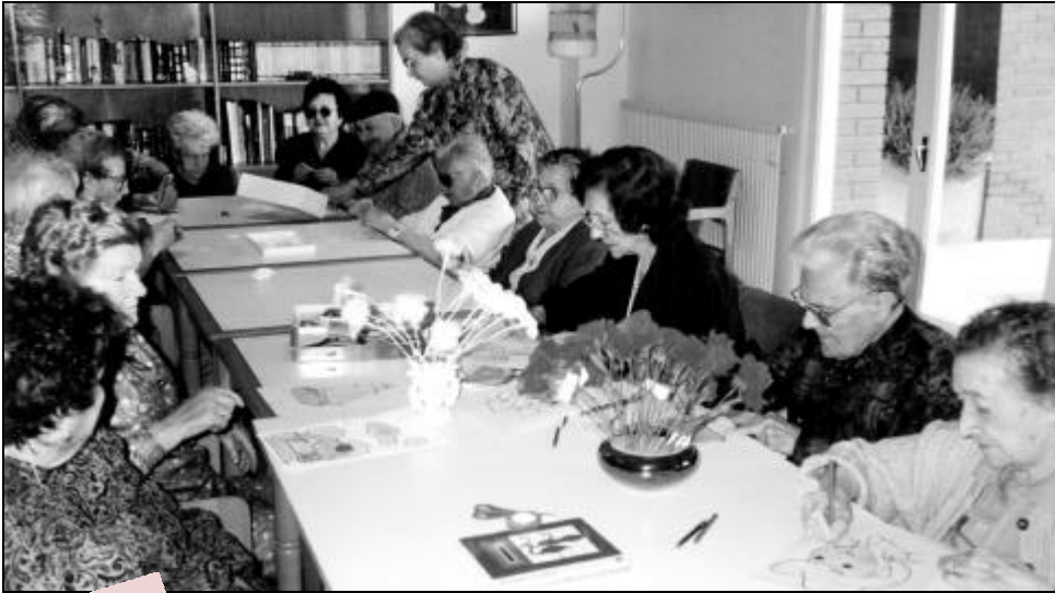
Una de les moltes activitats que fan a la Residència