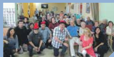
La Residència fa 30 anys PÀG. 12