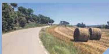
La Via Verda fa camí PÀG. 3